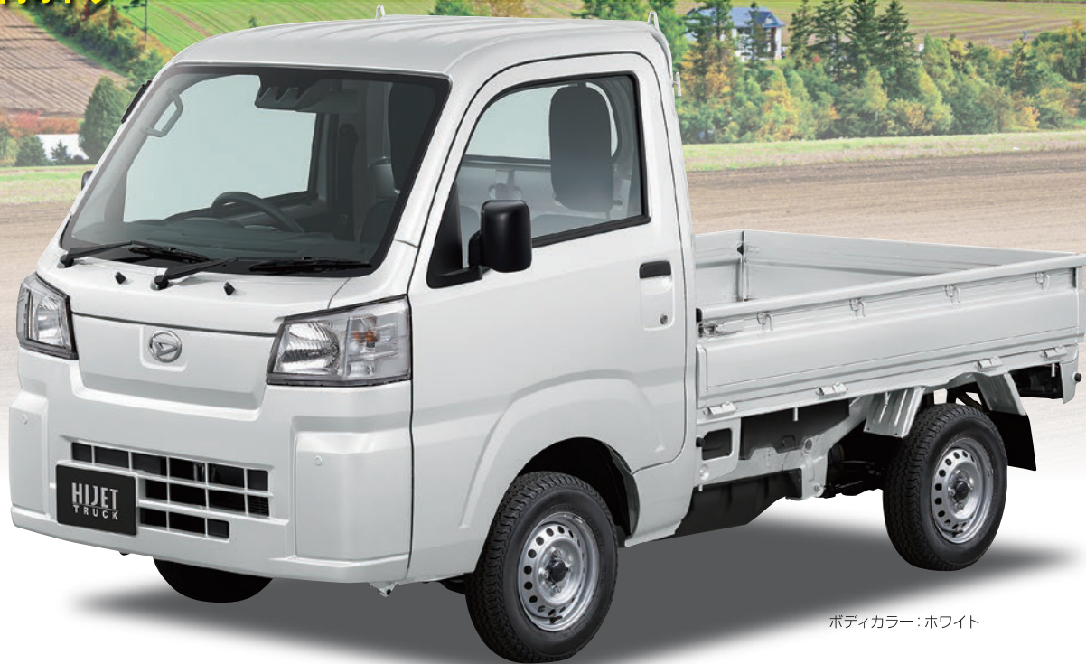
ボディカラー：ホワイト