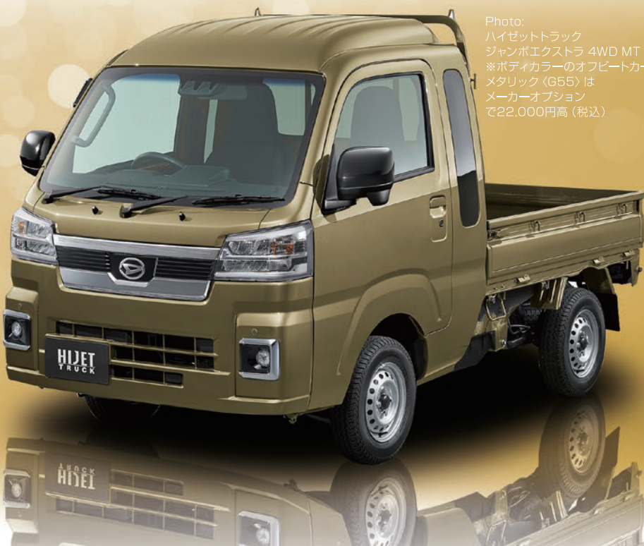
Photo: ハイゼットトラック ジャンボエクストラ 4WD MT ※ボディカラーのオフビートカーキ メタリック(G55)は メーカーオプション で22,000円高(税込)